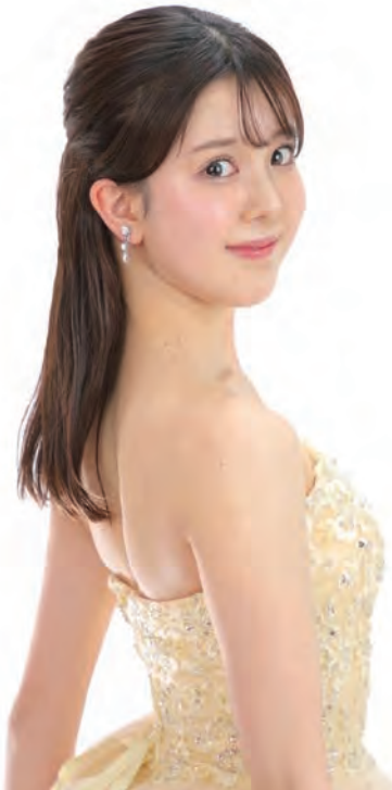
山田晃 / ヴァイオリン