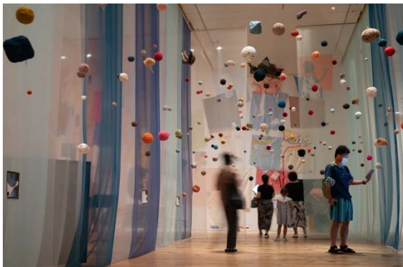
1 作品：五十嵐靖晃