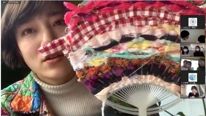
7 そねまい オンラインワークショップのようす