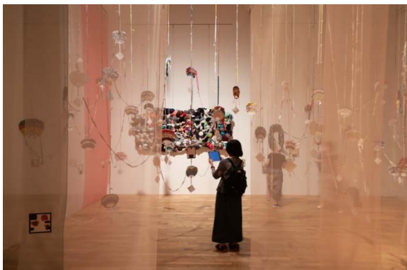
3 作品：そねまい