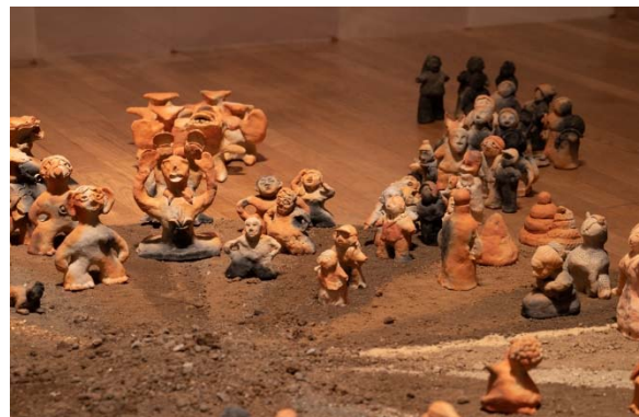
4 作品：布下翔基